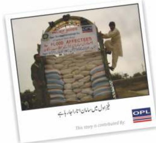
فیصل آباد میں سامان اتارنا جاری ہے