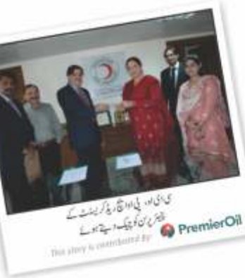
پی او ایل کی افواج پاکستان کے فیلڈ ریلیف کیمپ

2010ء میں پاکستان میں ہونے والی تباہ کن طوفانوں میں ہزاروں لوگوں کی جانیں ضائع ہو گئیں۔ اس حوالے سے پریمر آئل پاکستان نے سیلاب زدگان کی روپے اور اشیاء کی ضرورت دونوں طریقوں سے بھرپور مدد کی۔ فوری رد عمل کے طور پر پی او ایل نے بنیادی سلامتی کچھ سیلاب زدگان کو فراہم کیا، جس میں کھانے کی اشیاء، پینے کا صاف پانی، ادویات اور کپڑے وغیرہ شامل تھے۔ یہ امداد 550 متاثرہ خاندانوں کو فراہم کی گئی۔ یہ امداد کمپنی اور اس کے ملازمین دونوں نے فراہم کی۔ جہاں جہاں پینٹینا مشکل یا ناممکن تھا وہاں ہوائی جہازوں یا ہیلی کاپٹروں کے ذریعے افواج پاکستان کی مدد سے امداد پہنچائی گئی۔ اسی طرح پریمر آئل پاکستان نے 25,000 ڈالر کی رقم پاکستان کی دو معروف این جی او کے حوالے کی (تاکہ ضرورت مندوں کی ضرورت کی جاسکے)۔ اس میں سے ایک لاکھ ڈالر ریڈ کریسنٹ پاکستان کے حوالے کئے گئے جبکہ ڈیڑھ لاکھ ڈالر ایڈمی فاؤنڈیشن کو دیئے گئے۔ ریڈ کریسنٹ (جلال احمر) نے اسے اپنی ماہانہ فونڈنگ کی فراہمی میں صرف کیا جبکہ ایڈمی فاؤنڈیشن نے اسے بحالی کچھ کے طور پر استعمال کیا جس کے ذریعے انہوں نے متاثرین کو کچھ، کھانا، گھروں کی تعمیر کا میٹریل اور 12000 روپے فی خاندان عطیہ دیا۔ فیلڈ ریلیف کی کاروائیوں کے علاوہ پریمر پاکستان نے یونیورسٹی آف انجینئرنگ اینڈ ٹیکنالوجی لاہور میں ایکٹو جیٹر قائم کی، یہ جیٹر ڈیپارٹمنٹ آف پٹرولیم اینڈ گیس انجینئرنگ میں قائم کی گئی ہے۔