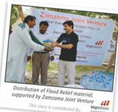
This story is contributed by: inptulior

300 families whereas 500 families were provided with clean drinking water for one month.