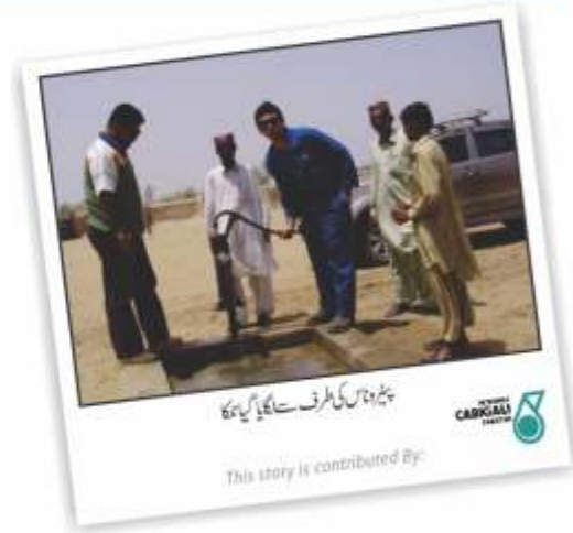
پٹرولیم کی طرف سے لگایا گیا کچا