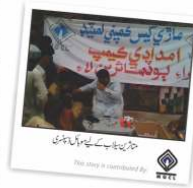
متاثرین سیلاب کے لیے مہیا کی گئی امداد

ایم جی سی ایل ایکسپلوریشن اینڈ پروڈکشن کے میدان میں دوسری بڑی کمپنی ہے۔ اس کا سب سے بڑا آئل فیلڈ سندھ کے ضلع ڈبر کی میں ہے، اس کے علاوہ اس کے پاس آٹھ بلاکس کی آپریشن بھی ہے، علاوہ ازیں پاکستان کے پانچ بلاکوں میں ان کی کام کے لحاظ سے دلچسپی ہے اور یہ دلچسپی عمان کے ایک بلاک میں بھی ہے۔ عمان میں اس کی ایم او ایل کے ساتھ شراکت ہے۔ ایم جی سی ایل کی سی ایس آر سرگرمیاں نہ صرف اس کے ابتدائی آپریشنل علاقے یعنی ڈبر کی میں جاری ہیں بلکہ ماڈی گیس دوسرے آپریشنل بلاکوں میں بھی سوشل ڈویلپمنٹ کے کاموں میں شریک کار ہے۔ ایم جی سی ایل نے سیلاب زدہ علاقوں میں بھی بہت سی سکیموں کا آغاز کیا ہے، بعض اہم سی ایس آر کاروائیوں کا ذکر ذیل میں کیا گیا ہے۔