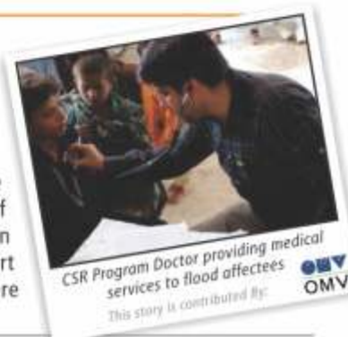
This story is contributed by: OMV

Monsoon of 2010 caused the worst flooding in Pakistan in its history. These floods swept through the entire country and caused devastation of an unprecedented magnitude. At one point, approximately one-fifth of Pakistan's total land area was underwater. Such a disaster demanded Government, NGOs, Industry and all other segments of the society to come forward and help the displaced. OMV Pakistan, realizing the severity of the disaster, made no delay in taking part in rescue and relief activities. As the floods hit the province of Sindh, which is where OMV's operational areas lie, and affected the lives of millions of people, as an immediate response, OMV Pakistan as an operator of its Joint Ventures in Khairpur helped District Government Khairpur in arranging flood relief camps by providing transport facility to its officials. The company also arranged cooked food for flood affected families who were