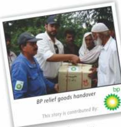
This story is contributed by: bp

On a concession level, BP in its operation areas spent US $ 250,000 on relief measures with the help of local government. Anti-snake venom serums were distributed among the villagers as part of this donation; this was coupled with ration bags and ready-to-eat meals to feed the displaced families.