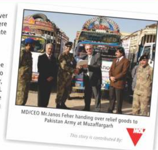
This story is contributed by: MOL

MOL Pakistan is aware of the devastation caused by the floods in Swat district, Khyber Pakhtunkhwa province and plans to support their affected communities in the near future.